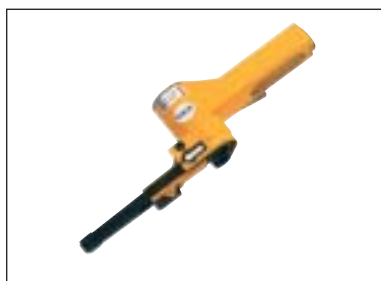
Pásová bruska • jiné, než uvedené typy brusných pásů na objednávku