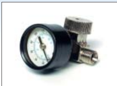
Regulátor s manometrem