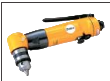
Úhlová vrtačka 3/8"