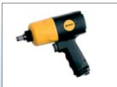
Příklepový utahovák 1/2"