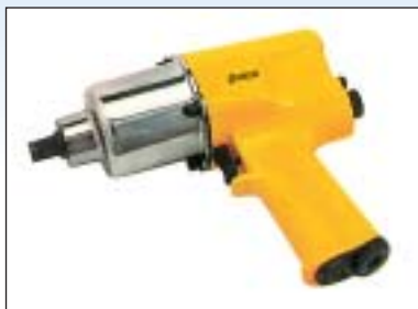
Příklepový utahovák 1/2"