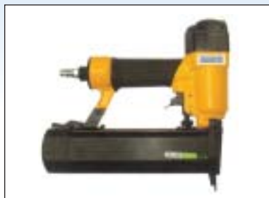
Sponkovačka kombinovaná s hřebíkovačkou