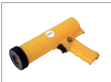
Pistole pro tuby - (kartuše)