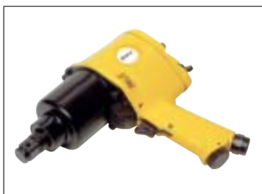
Příklepový utahovák 3/4"