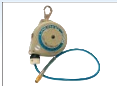
Balancér se vzduchovou hadicí