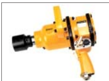
Příklepový utahovák 1"