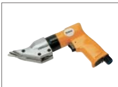
Nůžky na plech