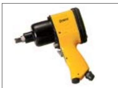
Příklepový utahovák 1/2"