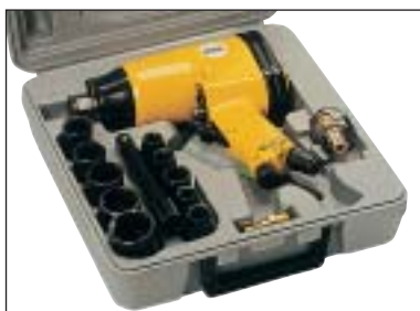
Příklepový utahovák 1/2" - sada