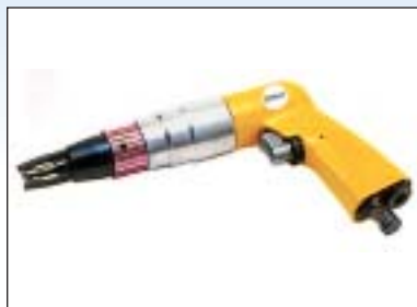
Odvrtávač bodových svárů