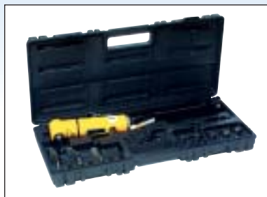
Vzduchový nůž - sada