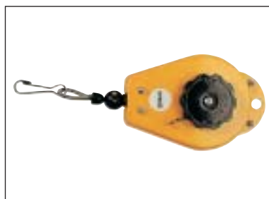
Balancér s ocelovým lankem