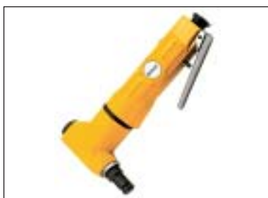
Prostřihávací nůžky na plech