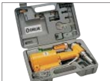
Nýtovací kleště - sada