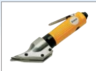
Nůžky na plech