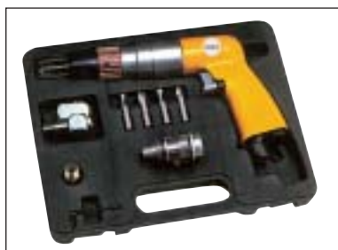
Odvrtávač bodových svárů OK 6054 v sadě, která obsahuje: