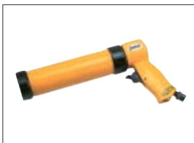
Pistole pro tuby - (kartuše)