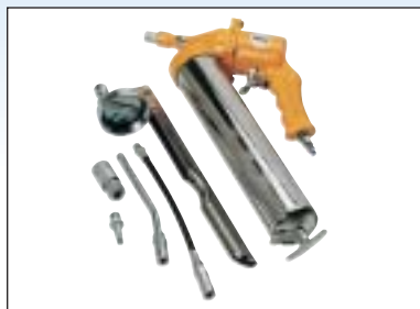
Tlaková maznice - sada