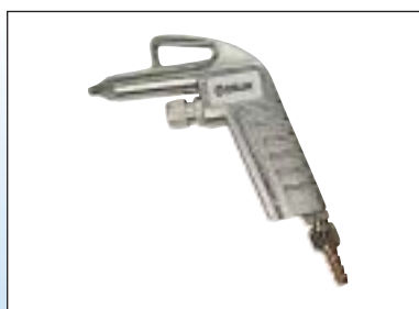
Ofukovací pistole AL