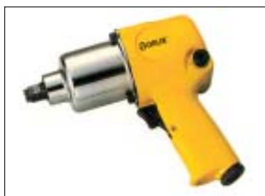
Příklepový utahovák 1/2"