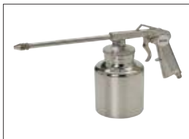
Mlžící pistole s nádobkou