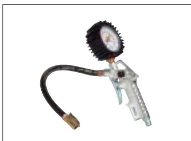
Plnicí pistole na huštění pneumatik