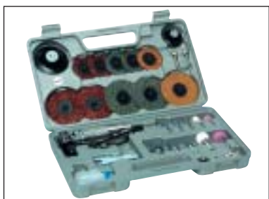
Úhlová bruska - sada