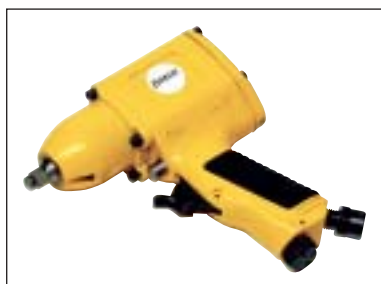
Příklepový utahovák 3/8"