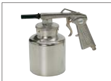
Mlžící pistole s nádobkou