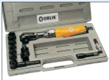
Ráčnový utahovák 1/2" - sada