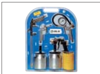
Hobby pneu sada