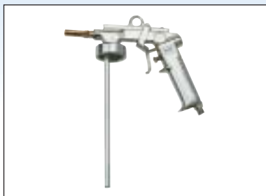
Pistole na stříkání dutin