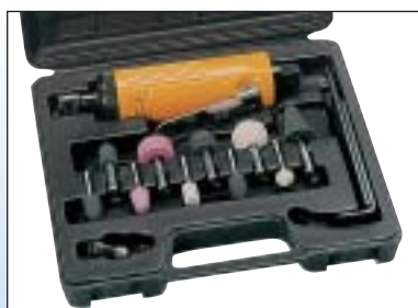
Bruska + brusná tělesa - sada