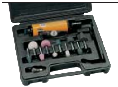
Bruska + brusná tělesa - sada