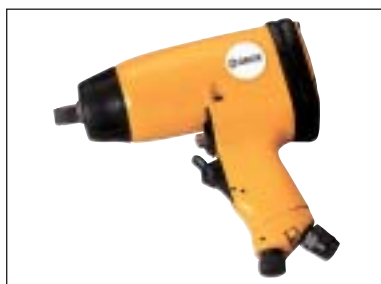
Příklepový utahovák 1/2"