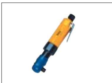
Ráčnový utahovák 1/4"