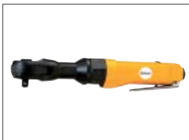
Ráčnový utahovák 1/2"