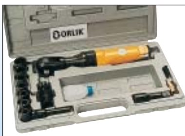
Ráčnový utahovák 3/8" - sada - OK 5001 Ráčnový utahovák 1/2" - sada - OK 5002